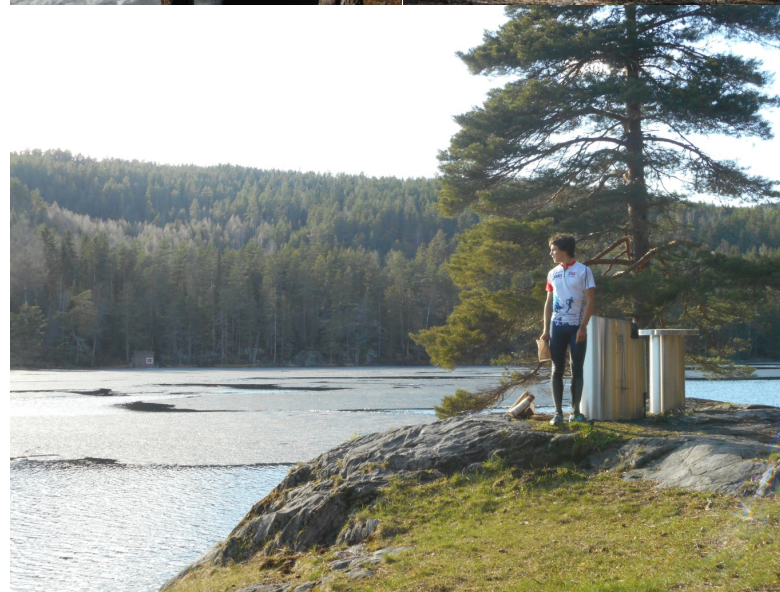
Swann et Juliette