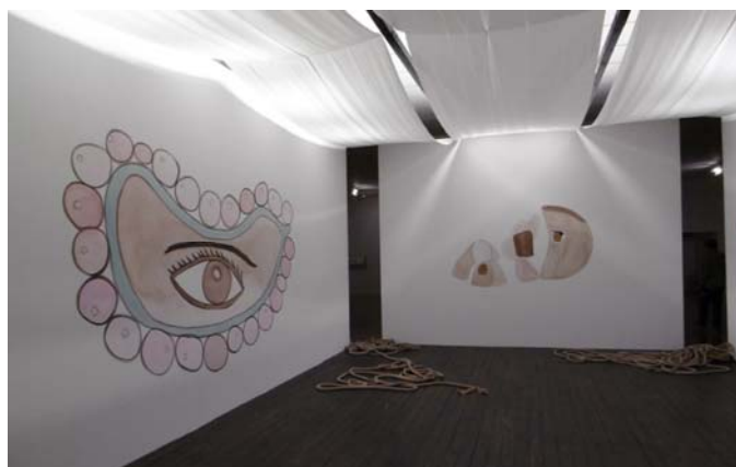
Vue de l'exposition Escaplogie au MAC Lyon