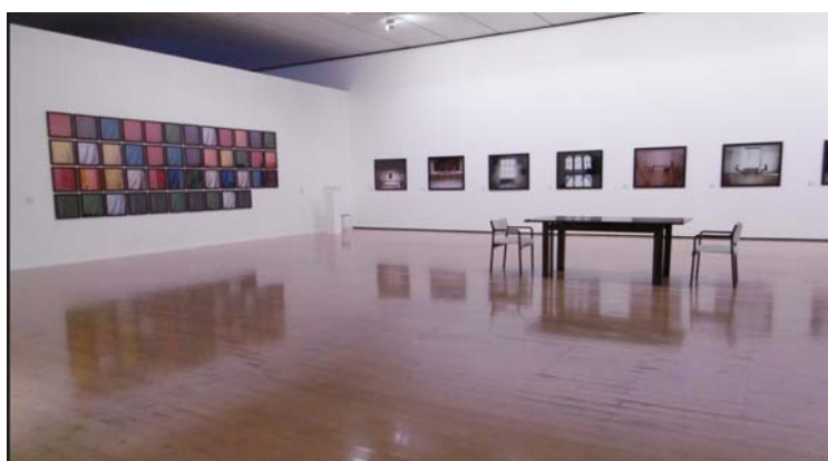
Vue de l'exposition au MAC Lyon