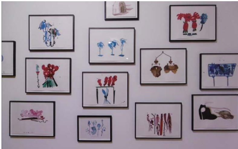
Vue de l'exposition Escapologie au MAC Lyon

Ça y est, nous arrivons! Au dernier étage! Pour y découvrir un couple... et pas des moindres ! Le couple Marina Abramovic & Ulay! Ils sont là, ils investissent les lieux pour Performances 1976-1988 . Ce sont les pionniers de la performance en Europe (quel honneur !). Dans leurs œuvres, ils mettent l'existence humaine à l'épreuve : rester assis durant tout une journée face à face pour une exposition, cela pendant 90 jours. Vous en voulez plus ?! Ils se mettent nus à l'entrée de leur propre exposition et les visiteurs doivent ainsi leur passer, littéralement, sur le corps avant d'entrer. De nombreuses expériences toutes plus rocambolesques les unes que les autres. Des performances qui marquent, à n'en pas douter, l'histoire de l'art contemporain!