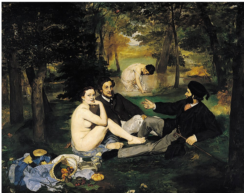
Edouard Manet (1832-1883), Le déjeuner sur l'herbe , 1863, huile sur toile, 208 x 264 cm, Musée d'Orsay, Paris.

Après cela, nous n'avons eu qu'à traverser le pont pour nous retrouver en visite libre au Musée d'Orsay, une ancienne gare transformée en musée. A titre personnel, j'ai profité de la liberté qui nous était offerte pour voir Le Déjeuner sur l'herbe de Manet, certains tableaux de Berthe Morisot, de Caillebotte, de Renoir, de Van Gogh, et bien d'autres,...