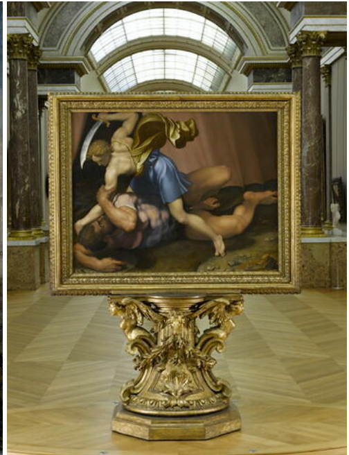
Daniele Da Volterra (1509-1566), David vainqueur de Goliath , 1550-1555, huile sur ardoise, Musée du Louvre, Paris.

Nous étions en deux groupes ; dans le mien, nous avons pu voir La Liberté guidant le peuple et David vainqueur de Goliath (un diptyque tournant... qui ne l'est plus aujourd'hui pour des questions de conservation). La guide était très intéressante et elle nous a permis de participer à la description des œuvres, mais aussi de partager notre ressenti.