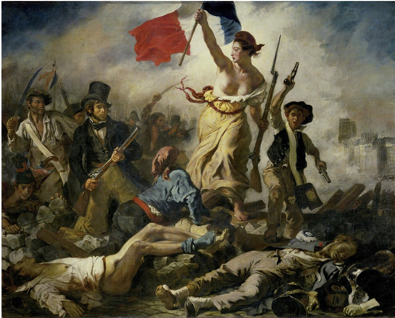
Eugène Delacroix (1798-1863), La Liberté guidant le peuple , 1830, huile sur toile, 260 x 325 cm, Musée du Louvre, Paris

Retour aux choses sérieuses avec un cours de méthodologie de la description d'œuvres avec deux dames qui étaient passionnées (et qui le faisaient ressentir !) et qui se sont vraiment mises à notre place pour être le plus claires possible. Puis nous avons pu faire un exercice blanc de description des Epoux Arnolfini de Jan Van Eyck, histoire de nous mettre en jambe car il s'agit d'une épreuve du concours, de même que l'exercice de repérage auquel nous nous sommes aussi frottés avant de suivre un TDO (entendez Travail Dirigé devant les Œuvres) au Louvre.