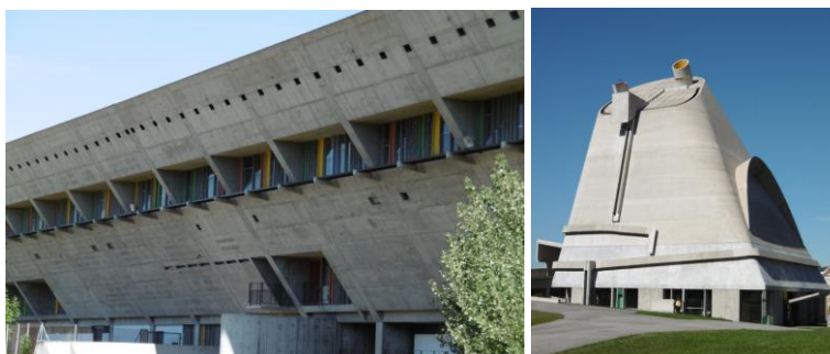
La Maison de la Culture depuis le stade et l'église Saint-Pierre

Le programme d'aménagement de Firminy-Vert s'est étalé sur près de 18 ans et Le Corbusier, mort en août 1965, n'en verra pas l'achèvement, ce qui explique le rôle qui fut dès lors dévolu à Wogenscky. Son Unité d'habitation est la dernière qu'il mit en chantier, après celles de Marseille, de Berlin, de Nantes... Notons qu'elle est classée, comme la plupart des sites corbuséens du quartier, au Patrimoine mondial de l'UNESCO et qu'elle est inscrite à l'inventaire des Bâtiments historiques. Il faut dire qu'il s'agit de son plus important ensemble urbain en Europe et le second dans le monde après Chandigarh en Inde.