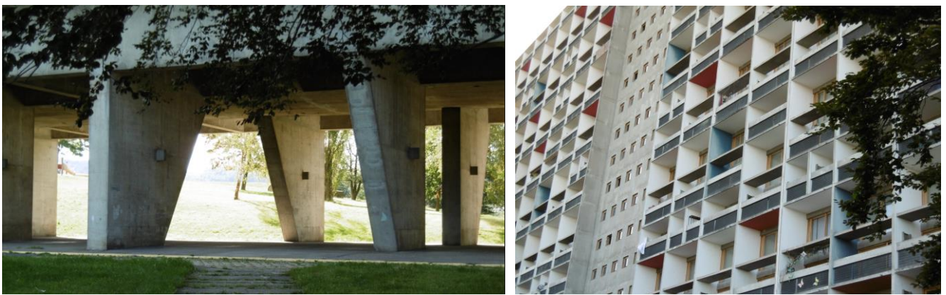
L'Unité d'habitation (façade libre / pilotis)