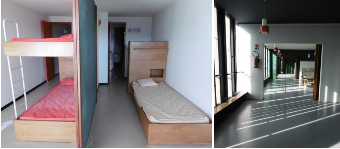
Chambres des enfants de l'Unité et école maternelle du dernier niveau

Au sommet de l'édifice, conçu comme une ville verticale, on trouve une école qui a accueilli, jusqu'au seuil des années 2000, les jeunes enfants de la Cité radieuse. En revanche, à la différence de celle de Marseille, la Cité de Firminy n'a jamais abrité de rue commerçante où l'on aurait pu trouver coiffeur, primeur, restaurant, bureau de tabac, etc.