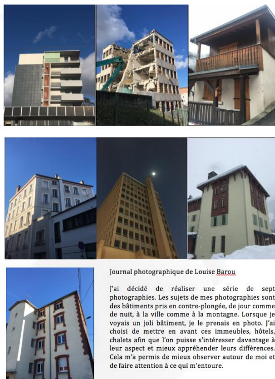
Journal photographique de Louise Barou

J'ai décidé de réaliser une série de sept photographies. Les sujets de mes photographies sont des bâtiments pris en contre-plongée, de jour comme de nuit, à la ville comme à la montagne. Lorsque je voyais un joli bâtiment, je le prenais en photo. J'ai choisi de mettre en avant ces immeubles, hôtels, chalets afin que l'on puisse s'intéresser davantage à leur aspect et mieux appréhender leurs différences. Cela m'a permis de mieux observer autour de moi et de faire attention à ce qui m'entoure.